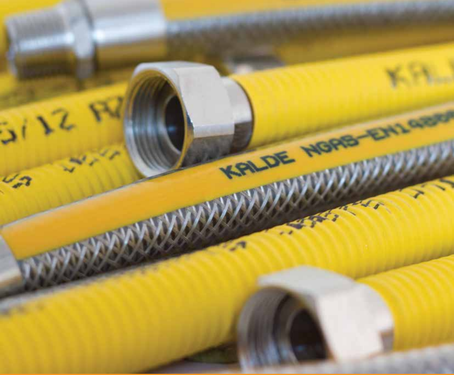
Flexo Gaz Hortumları