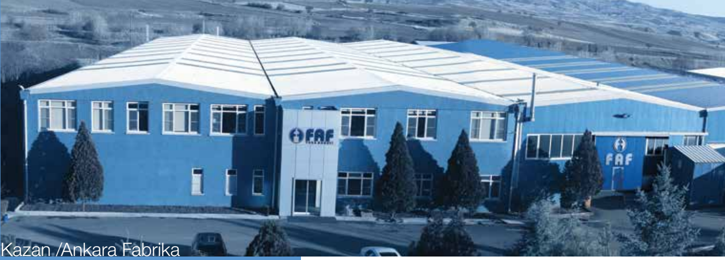
Kazan /Ankara Fabrika

Kurulduğumuz günden beri, 30 yılı aşkın süredir, değerlerimize kayıtsız bağlılıkla, aile ruhunu kaybetmeden, bizim için önceliğimiz olan müşterilerimize hizmet vermeye devam ediyoruz.