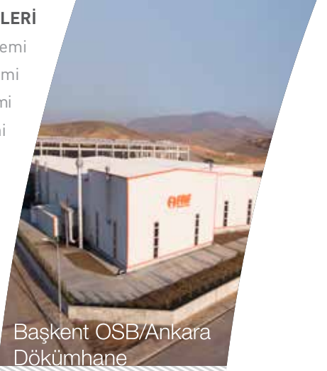
Başkent OSB/Ankara Dökümhane